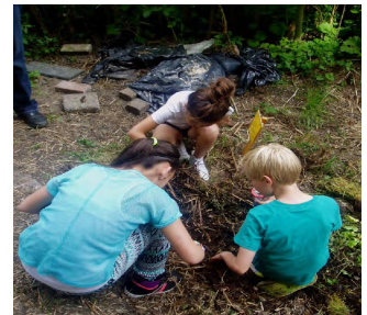
Schooltuin bij de nieuwe locatie

Er zijn vier bakken/borders die met allerlei planten gevuld zijn. Ook zijn inmiddels een 12-tal grote bessen- en frambozenstruiken geplant. In een later stadium zou het leuk zijn als ook De Hortus hier een buitenles kan maken over hoe je ook thuis je eigen groente kan kweken en dan de les combineren met gezond voedsel.